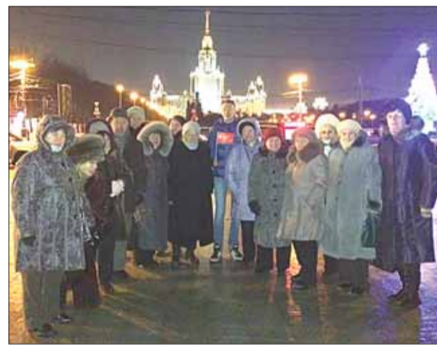
фото на фоне грандиозного архитектурного проекта Б.М. Иофана, одной из 7-и сталинских высоток, Главного здания Московского

Поездка прошла в тёплой дружеской атмосфере, в конце которой все участники сделали коллективное