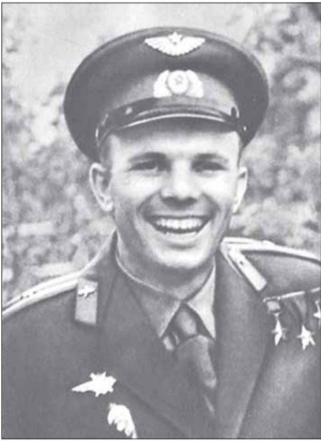
Гагарин Юрий Алексеевич, лётчик — космонавт СССР, полковник, первый человек, совершивший полёт в космос, Герой Советского Союза. Депутат Верховного Совета СССР. Член КПСС с 1960 г.

В 1951 г. окончил ремесленное училище литейщиков под Москвой, в 1955 г. окончил Саратовский индустриальный техникум и одновременно школу аэроклуба, в 1957 г. окончил 1-е Чкаловское военное-авиационное училище лётчиков. В 1968 г. окончил Военно-воздушную инженерную академию. С 1960 г. — в отряде космонавтов. 12 апреля 1961 г. совершил космический полёт, облетаев на корабле «Восток» за 1 час 48 минут земной шар. Погиб 27 марта 1968 г. в результате катастрофы при выполнении тренировочного полёта на самолёте.